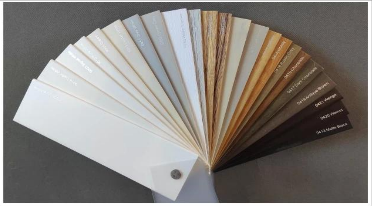
Örnek kutu stili ve ayrıntıları