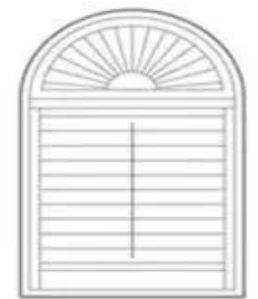
Sunburst Above Shutters