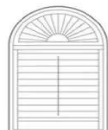
Sunburst Above Shutters