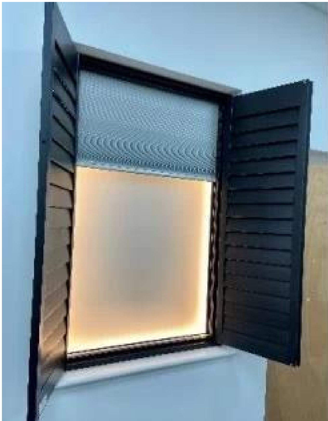
5. Przymocuj przezroczyste uchwyty dostarczone do podnoszenia/opuszczania żaluzji.