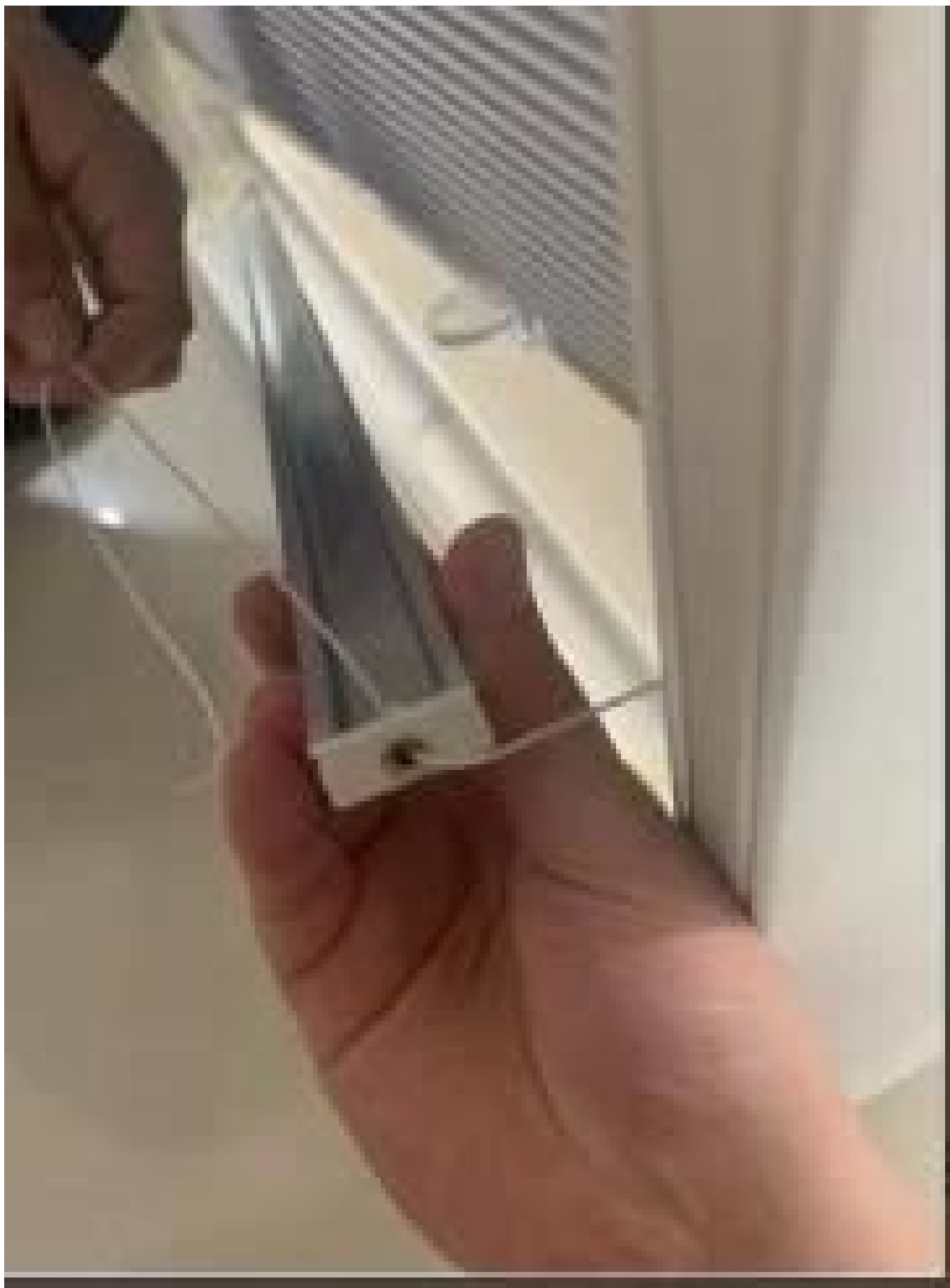
9. Rolety można zdjąć, naciskając przycisk plecy wspornika i roleta zostanie zwolniona.