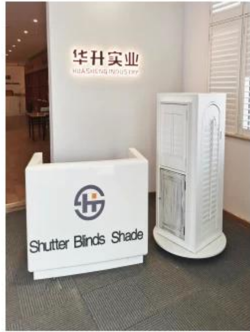
使用场景 Usage scenario