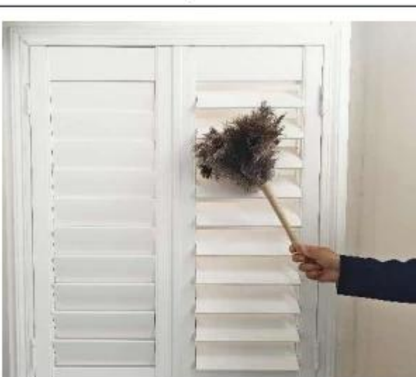
使用场景 Usage scenario