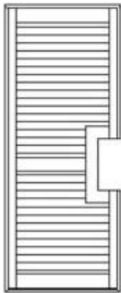
法式门 Franch door