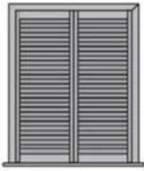
Full Height Shutters