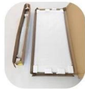
Pannel & Frame Classifie