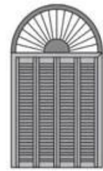
Shutter With Screen Shade