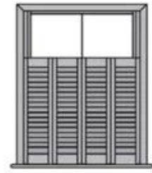
Cafe Style Shutters