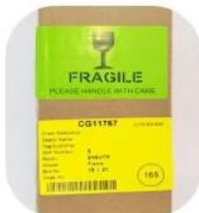
Marks /warning labels