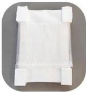
Air Bag Packaging