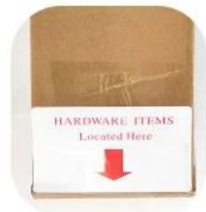
Hardware box instruction labels