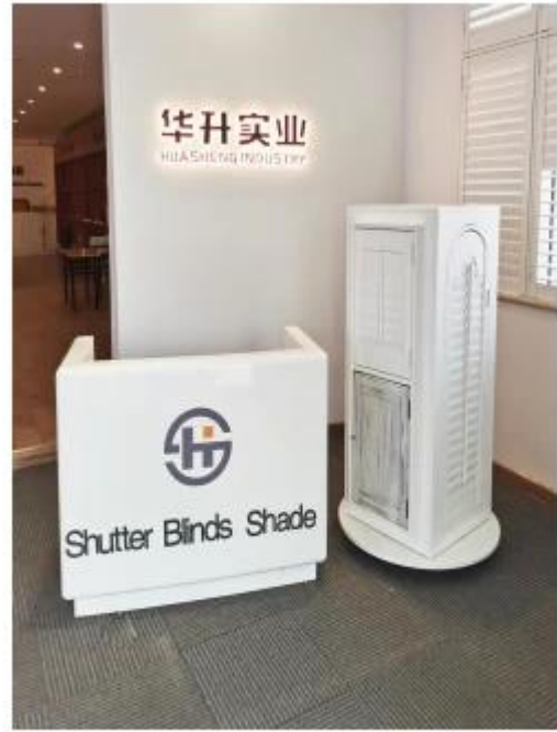
使用场景 Usage scenario