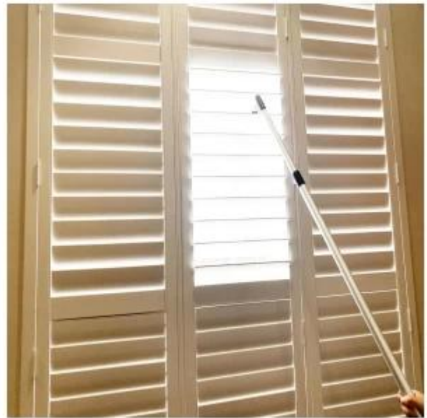
使用场景 Usage scenario