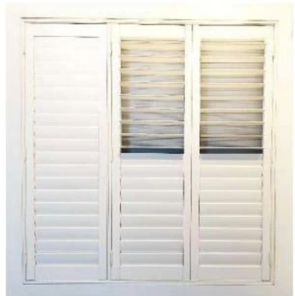
使用场景 Usage scenario