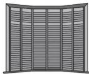
海湾窗 Bay window