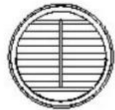
圆形磁铁固定窗 Magnet fixation