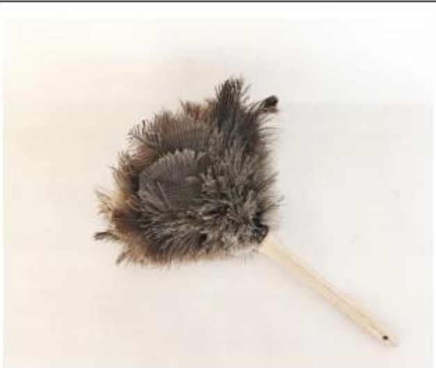
鸵鸟毛掸子 Ostrich feather duster