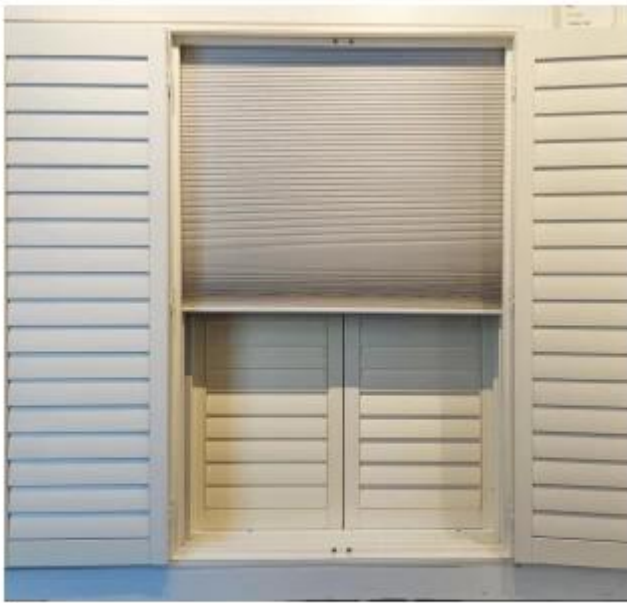
蜂巢帘 Honeycomb Blinds