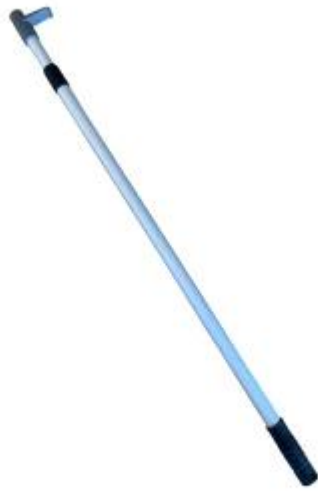
伸缩杆 4 side display