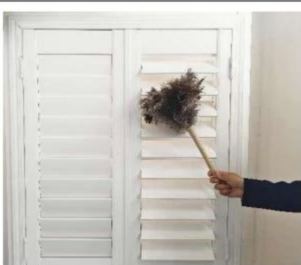
使用场景 Usage scenario