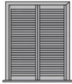
常规窗 Full Hight