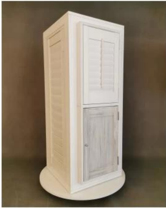
四边展架 4 side display