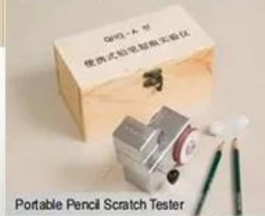
Portable Pencil Scratch Tester