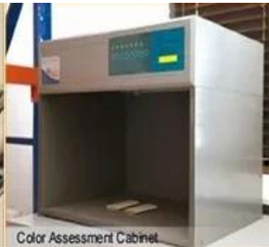
Color Assessment Cabinet