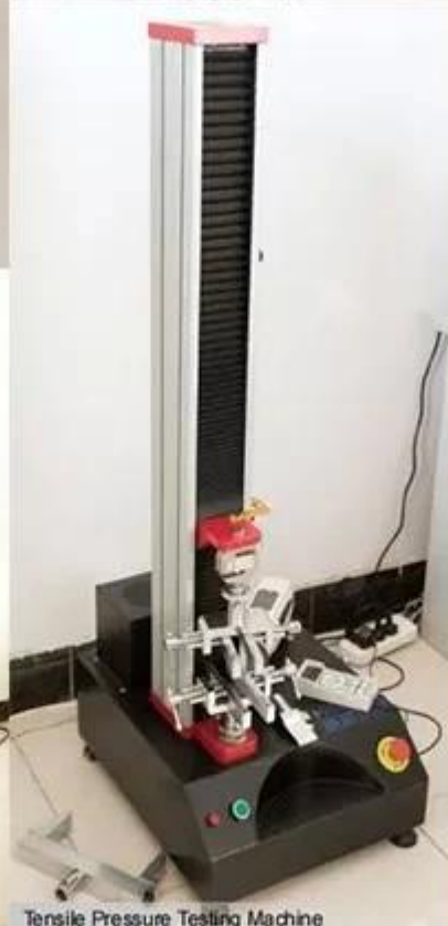
Tensile Pressure Testing Machine