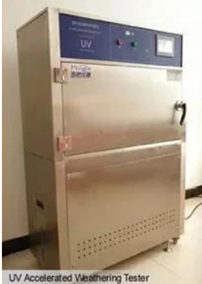
UV Accelerated Weathering Tester