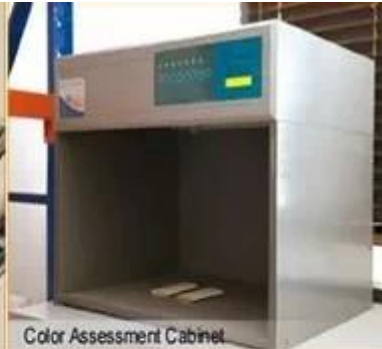
Color Assessment Cabinet