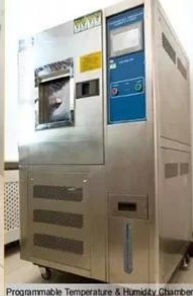
Programmable Temperature & Humidity Chamber