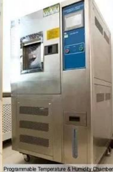
Programmable Temperature & Humidity Chamber