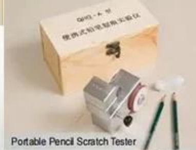
Portable Pencil Scratch Tester