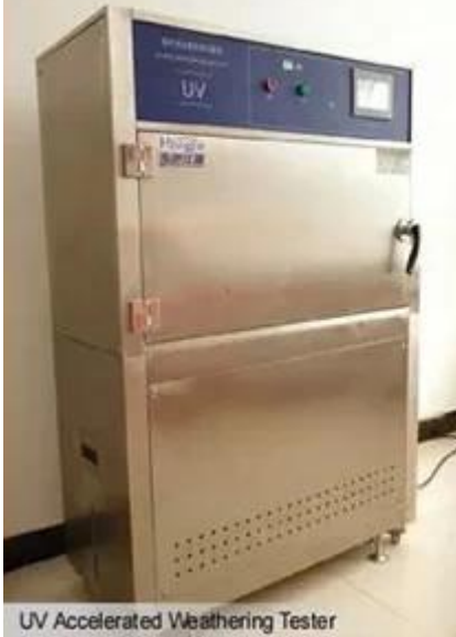
UV Accelerated Weathering Tester