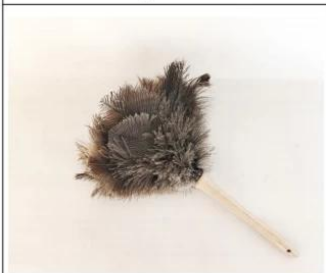
鸵鸟毛掸子 Ostrich feather duster