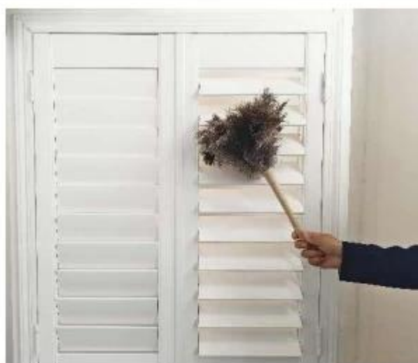
使用场景 Usage scenario