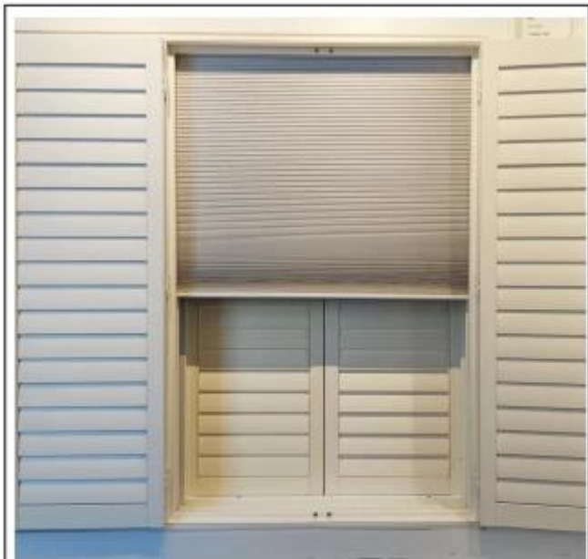
蜂巢帘 Honeycomb Blinds