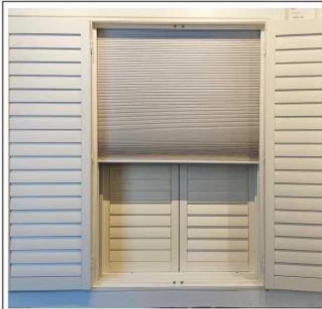
蜂巢帘 Honeycomb Blinds