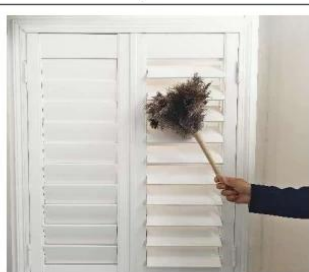
使用场景 Usage scenario